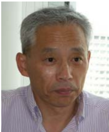
日本知的財産協会 職務発明タスクフォースリーダー (新日鐵住金知的財産部 企画室 主幹)

産業発展のために特許法は重要ですが、特許法第 35 条は労働法の性格も持っています。大正デモクラシーのあった大正 10 年法が制定された時代には労働者保護の観点があり、労働者の補償金請求権がありました。昭和 34 年法の改正の際、補償金請求権が対価請求権（相当の対価）に変更されました。「補償金」はいわば「償いのお金」です。発明の成果が発明者への「償いのお金」では少し違和感があります。そこで「相当の対価」に変更されました。