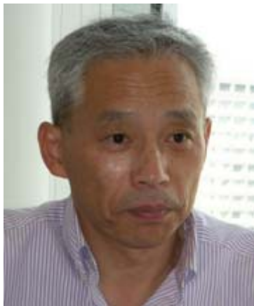
日本知的財産協会 職務発明タスクフォースリーダー (新日鐵住金知的財産部 企画室 主幹)

産業発展のために特許法は重要ですが、特許法第 35 条は労働法の性格も持っています。大正デモクラシーのあった大正 10 年法が制定された時代には労働者保護の観点があり、労働者の補償金請求権がありました。昭和 34 年法の改正の際、補償金請求権が対価請求権（相当の対価）に変更されました。「補償金」はいわば「償いのお金」です。発明の成果が発明者への「償いのお金」では少し違和感があります。そこで「相当の対価」に変更されました。