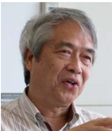
日本経済団体連合会 知的財産委員会企画部会部 会長代行 (三好内外国特許事務所 副所長)

企業は職務発明そのものが生まれるまでの状況およびその事業化にあたって多額の投資を実施しており、我々は対価の決定に際して比較的自由に企業が決定できると考えていました。ところが中村裁判に先立つ 2 年前、オリンパスの光ピックアップ技術に関する特許紛争の判決がありました。その判決は、職務発明の権利譲渡に伴う対価を企業が任意に決めることはできないという内容でした。企業が決定した対価に対して発明者に不服がある場合、裁判によって決めることが明示されました。こうした法的な判断が下された結果、企業にとって重大な問題が発生しました。